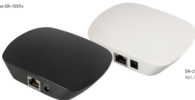
SR-2818WiN Black Арт. 020955