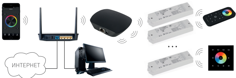
Рисунок 2. Подключение через роутер с использованием домашней сети Wi-Fi).