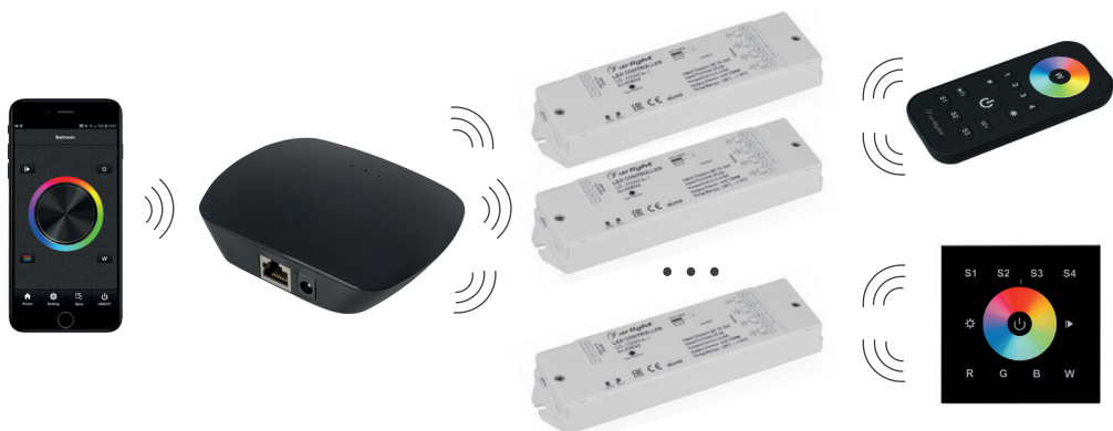
Рисунок 1. Прямое подключение смартфона к конвертеру (без использования домашней сети Wi-Fi).

3.2. Подключите конвертер по одной из нижеприведенных схем.