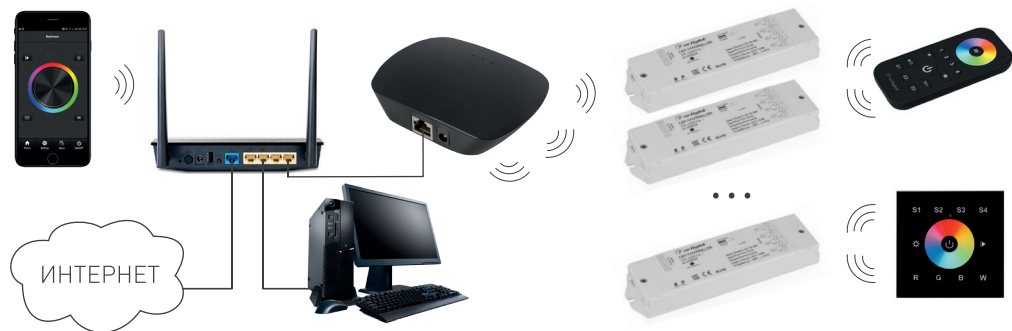
Рисунок 3. Подключение через роутер с использованием проводного соединения.

3.3. Подключите разъем сетевого адаптера к гнезду питания конвертера.